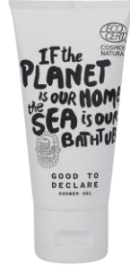
Shower Gel 40ml