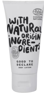
Body Lotion 40ml