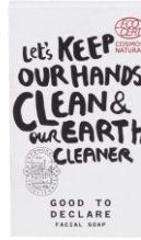
Bar Soap 40g