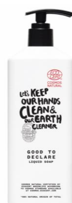
Liquid Soap 360ml