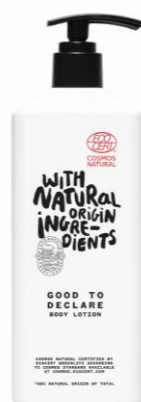
Body Lotion 360ml