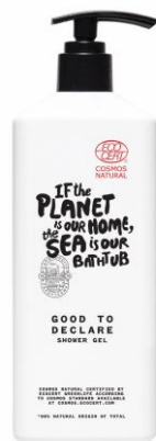
Shower Gel 360ml