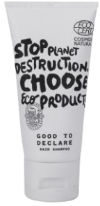
Shampoo 40 ml