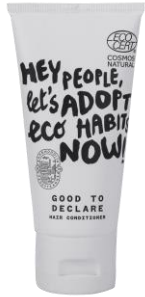
Conditioner 40 ml