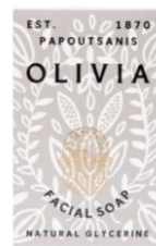
Facial Soap 40g