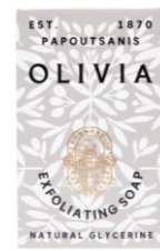
Exfoliating Soap 40g